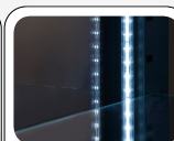
Εσωτερικός φωτισμός LED