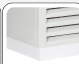
Ξύλινο κάλυμμα τροχών