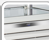
Ηλεκτρονικός θερμοστάτης με λειτουργία WI-FI